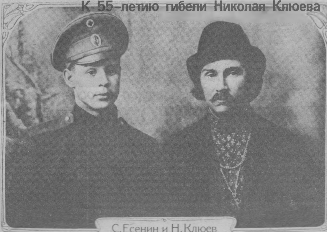
С. Есенин и Н. Клюев

при первом взгляде на его «дело» поняли, что шито оно белыми нитками.