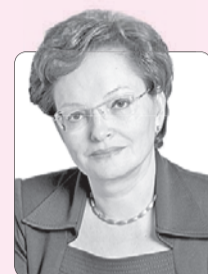
Оксана Козловская, председатель Законодательной думы Томской области