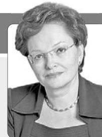
Оксана Козловская, председатель Законодательной думы Томской области