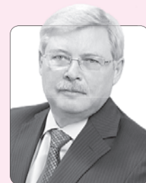
Сергей Жвачкин, губернатор Томской области

Несмотря на то что все мы разные, благодаря особому университетскому духу и неповторимому сибирскому характеру мы умеем слушать и слышать друг друга. Давайте и впредь бережно хранить этот мир и единство. И пусть личные успехи каждого станут общим успехом нашей страны!