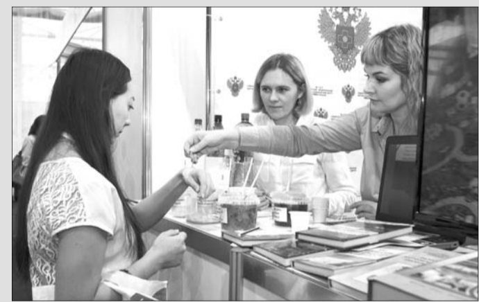
■ Материалы полосы подготовила Светлана Федорова

– Преимущество томской науки в том, что в ней соединены теория и практика. У нас очень короткий путь от разработок до внедрения. Это касается высоких технологий, космоса, оборонно-способности нашей страны, промышленности и медицины. И не случайно Федеральное агентство научных организаций приняло решение о создании в Томске крупнейшего центра на базе научно-исследовательских институтов медицинского профиля, – напомнил Сергей Жвачкин.