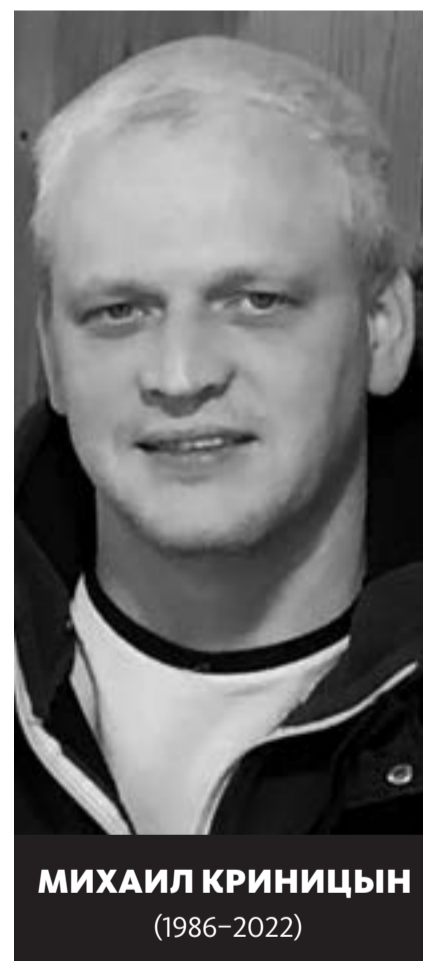
МИХАИЛ КРИНИЦЫН (1986–2022)