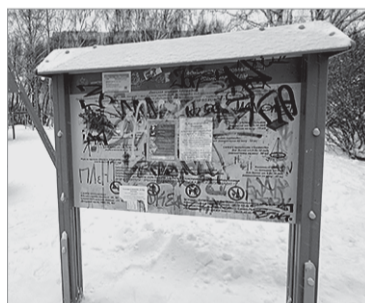
■ Андрей Суков

Руководство города проинспектировало состояние детских площадок, обустроенных в рамках нацпроекта