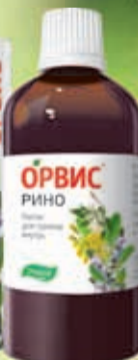
Капли для приема внутрь

ОРВИС – все, что нужно от ОРВИ и гриппа!