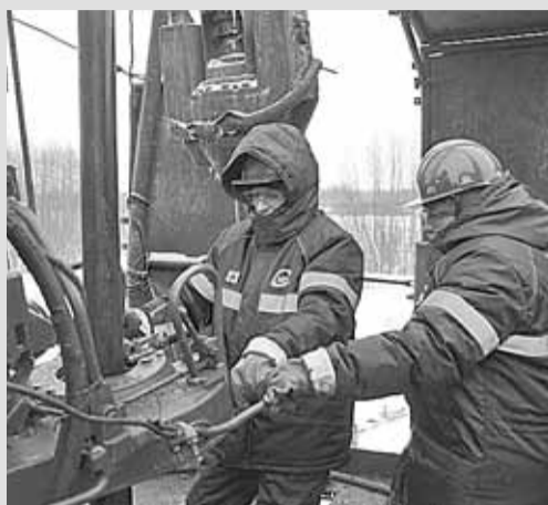
■ 47 скважин по методу ЗБС восстанавливает в этом году «Томскнефть»

«Томскнефть» применяет современные технологии при реконструкции скважин