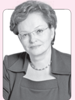
Оксана Козловская, председатель Законодательной думы Томской области