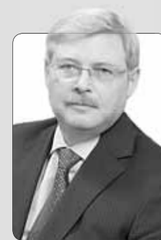
Сергей Жвачкин, губернатор Томской области

Желаем налоговой службе быть еще удобнее для людей и бизнеса, а работникам ФНС – счастья, здоровья и профессионализма!