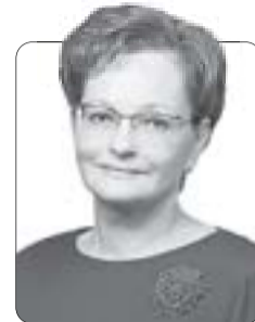
Оксана Козловская, председатель Законодательной думы Томской области