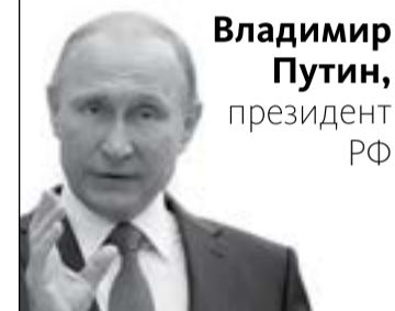
Владимир Путин, президент РФ

“ Прошу правительство постоянно держать на контроле разработку дополнительных мер поддержки семей с детьми, они должны носить кардинальный характер, соразмерный масштабу чрезвычайного демографического вызова, с которым мы сталкиваемся.