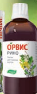
Капли для приема внутрь