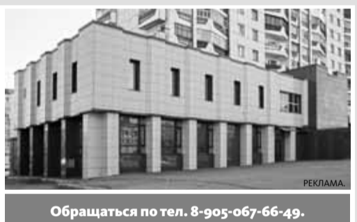
Обращаться по тел. 8-905-067-66-49.

В СООТВЕТСТВИИ со ст. 13, 13.1 Федерального закона от 24.07.2002 № 101-ФЗ «Об обороте земель сельскохозяйственного назначения» извещаются участники общей долевой собственности о согласовании проекта межевания земельных участков.