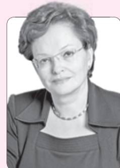
Оксана Козловская, председатель Законодательной думы Томской области