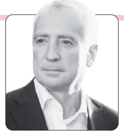
Владимир Мазур, губернатор Томской области

От всего сердца поздравляем вас с профессиональным праздником!