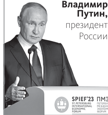
Владимир Путин, президент России

«Расширение экономических возможностей России, ее потенциала должно быть прямо увязано с повышением благосостояния наших граждан. Именно в этом и состоит воплощение экономического роста.»