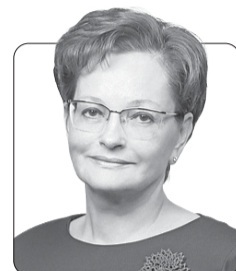
Оксана Козловская , председатель Законодательной думы Томской области