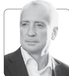
Владимир Мазур , губернатор Томской области

В этот праздничный и каждый день желаем вам счастья, радости, достатка и, конечно, крепкого здоровья!