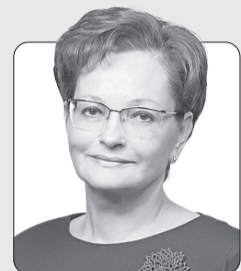
Оксана Козловская, председатель Законодательной думы Томской области

Желаем вам, романтикам и первопроходцам, новых открытий на благо нефтегазовой промышленности и Томской области, счастья, здоровья и всего самого доброго!