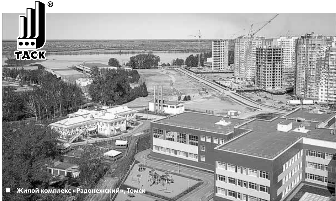
■ Жилой комплекс «Радонежский», Томск

В рамках освоения участка, находящегося в близости, разработан проект мегарайона Южные Ворота – 2. В перспективе он может быть в 1,5 раза больше первого. Ситуация там пока достаточно сложная: нужно менять генеральный план поселка Зонального и переводить участок из категории земель сельскохозяйственного назначения. Идут поиски решения: мы обратились к руководству муниципального образования, в итоге постановлением главы этого поселения нам поручено разработать проект планировки.