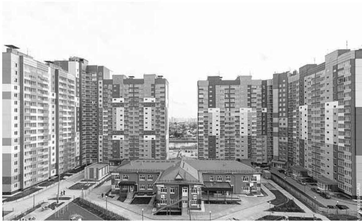
■ Жилой комплекс «Аквамарин», Новосибирск

Домостроители – об идеях и планах на будущее