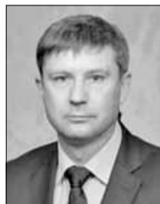
Дмитрий Никулин, депутат Законодательной думы Томской области

...И НЕ ТОЛЬКО Внимательно слушала послание президента. Похоже, что социальная сфера получит дополнительные возможности для развития. В поселках люди живут скромно, и для них меры такой соцподдержки очень важны.