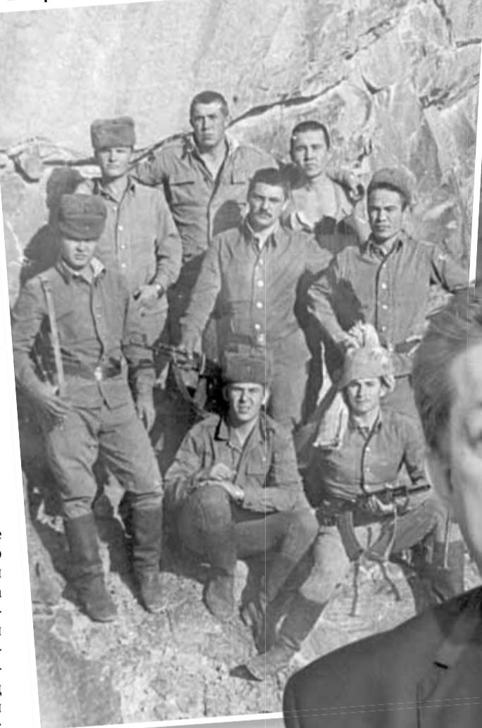
■ Крепость скала (1988)