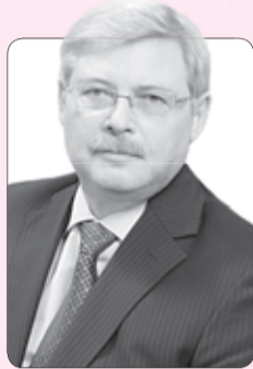
Сергей Жвачкин, губернатор Томской области

Желаем бойцам много интересной и хорошо оплачиваемой работы, ветеранам – радостных воспоминаний о счастливой юности, а всем нам – бережно хранить и развивать отличные традиции, которым в прошлом году исполнилось 55!