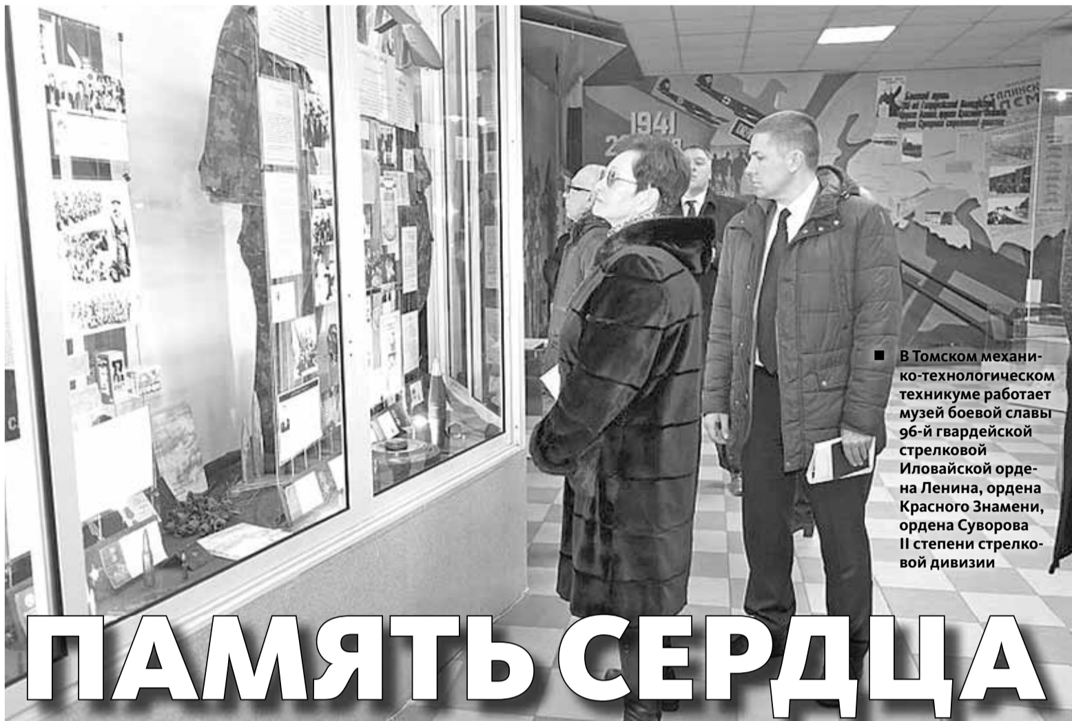
■ В Томском механико-технологическом техникуме работает музей боевой славы 96-й гвардейской стрелковой Иловской ордена Ленина, ордена Красного Знамени, ордена Суворова II степени стрелковой дивизии