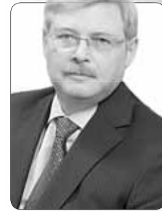
Сергей Жвачкин, губернатор Томской области

Желаем вам радостной встречи самого семейного праздника. Хорошего отдыха в новогодние каникулы, крепкого здоровья, счастья, радости, успехов, любви и праздничного настроения каждый день нового года! С наступающим 2021-м!