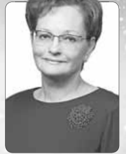
Оксана Козловская, председатель Законодательной думы Томской области