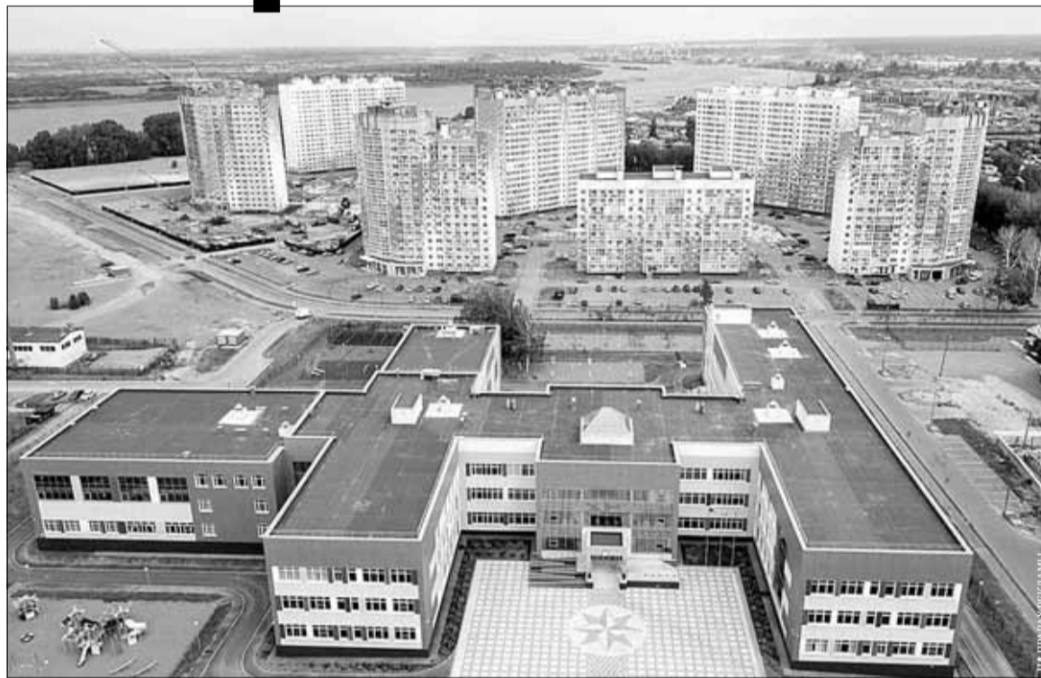
■ Жилой комплекс Радонежский

Строительство по лекалам нового тысячелетия