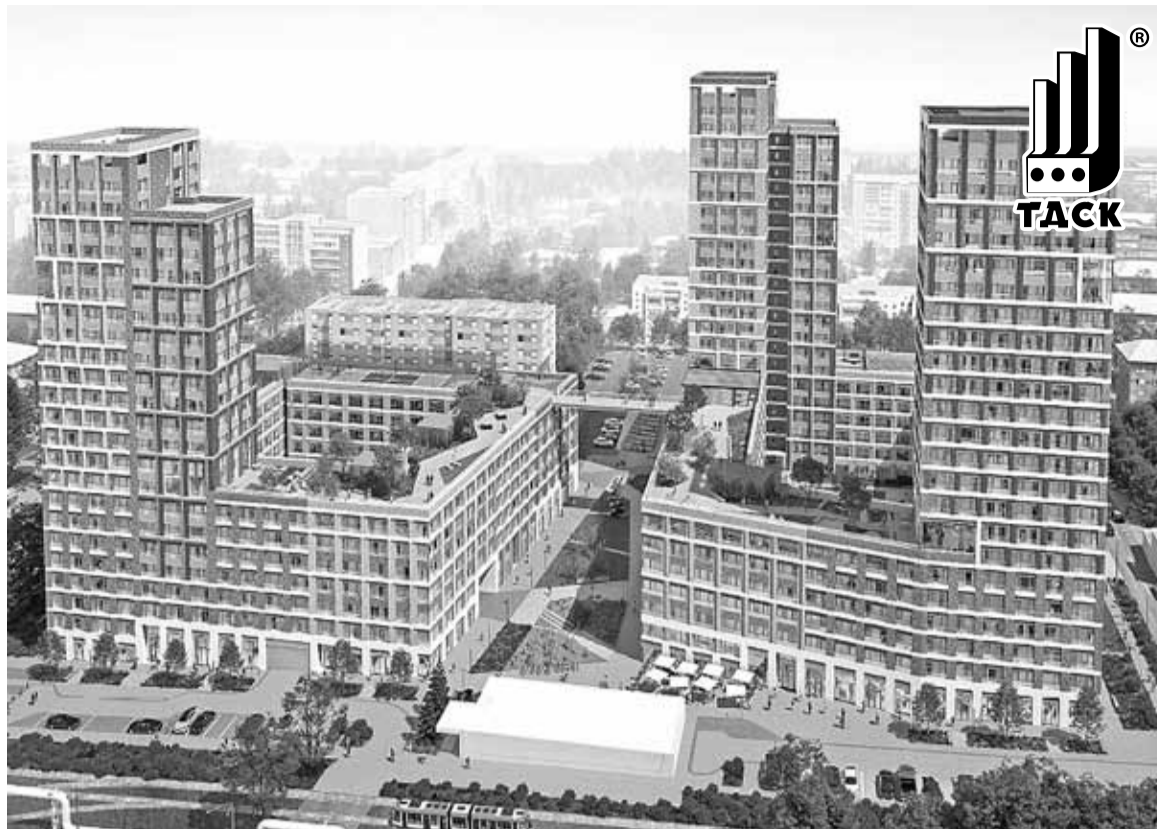
■ Проект жилого комплекса на пр. Комсомольском, 48

За два десятилетия нового века компания создала мощнейшую производственную базу и вырастила высокопрофессиональный коллектив из более трех тысяч специалистов. География деятельности компании распространяется не только на Томскую область (города Северск, Колпашево, Стрежевой, Кедровый, районные центры), но и на соседние регионы. А неизменно безупречного качества продукция завода КПД ТДСК представлена на самых важных объектах страны от Санкт-Петербурга до Дальнего Востока.