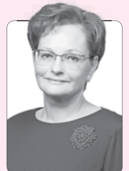
Оксана Козловская, председатель Законодательной думы Томской области