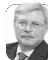
Сергей Жвачкин, губернатор Томской области

На долю мировых судей приходится значительный объем дел, однако вы уверенно справляетесь с растущей нагрузкой, демонстрируя компетентность и неравнодушие к людям. Спасибо вам за преданность делу и закону, служению которому вы посвятили жизнь.