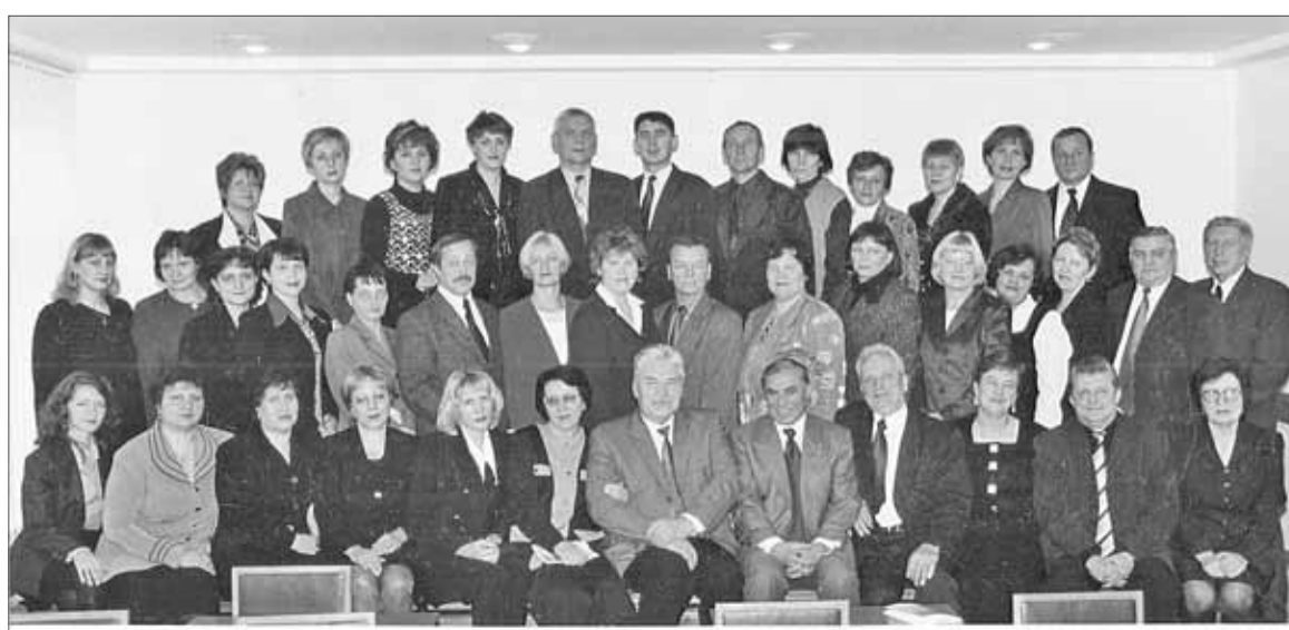
■ Ноябрь, 2001 год: первый состав мировых судей Томской области