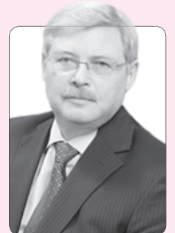
Сергей Жвачкин, губернатор Томской области

Желаем вам здоровья, счастья, стабильной работы и всего самого доброго!