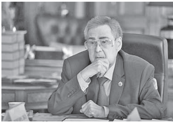
Томичей к этому процессу привлечь даже никто и не подумал.