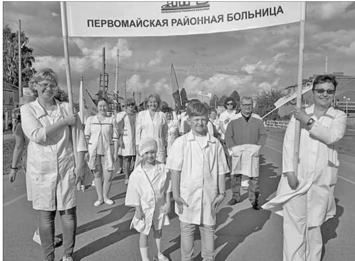
■ Коллектив Первомайской РБ принял активное участие в торжествах, посвященных 80-летию района (июль 2019 года)

Как районная больница в Причулымье реагирует на вызовы времени