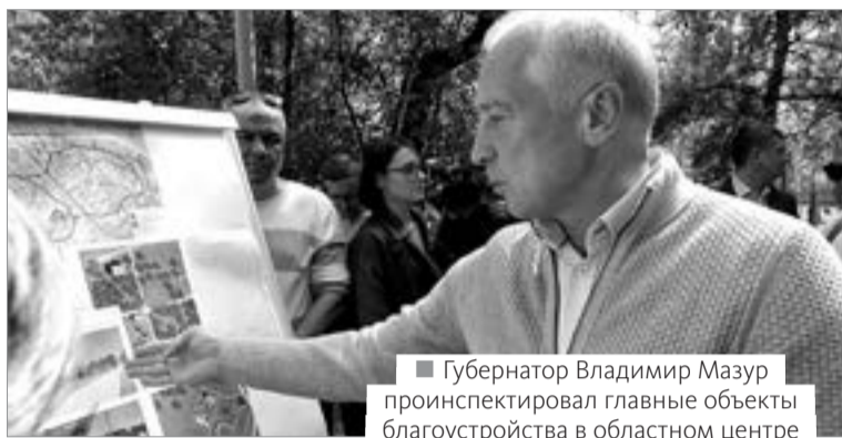
■ Губернатор Владимир Мазур проинспектировал главные объекты благоустройства в областном центре