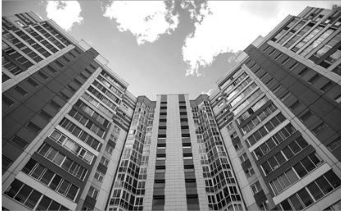
На правах рекламы.

Общение репродуктологов с журналистами продолжалось более полутора часов, и все новые вопросы возникали в ходе разговора. Но, как вы думаете, что сказали доктору, прощаясь с благодарной аудиторией? Они пожелали всем... чаще заниматься любовью. И не затягивать с рождением детей. Потому что даже самые современные технологии не заменят молодости и здоровья.