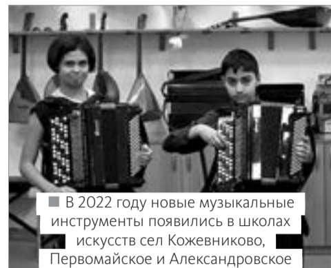
■ В 2022 году новые музыкальные инструменты появились в школах искусств сел Кожевниково, Первомайское и Александровское

Как национальные проекты преобразуют томские города и села