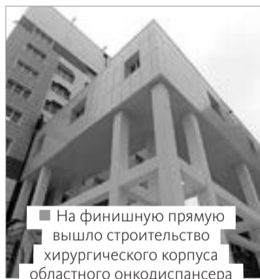
■ На финишную прямую вышло строительство хирургического корпуса областного онкодиспансера

Если цыплят считают по осени, то черту под нацпроектами подводят ближе к новому году. Хотя львиная доля труда приходится на теплый сезон, окончательные результаты подбиваются уже при «белых мухах». Сегодня мы итожим, что прожили: в километрах дорог, тысячах новоселов, сотнях мест в детских садах и десятках благоустроенных территорий. Оглядываясь назад и одновременно загадываем наперед. Ну что, поехали?