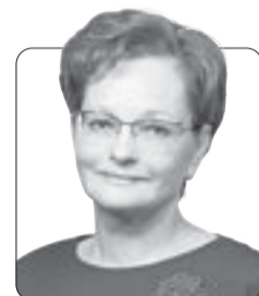
Оксана Козловская, председатель Законодательной думы Томской области