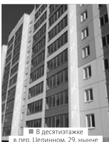
■ В десятиэтажке в пер. Целинном, 29, нынче осенью загорелся свет – здесь начали обживать первые расселенцы

Национальный проект «Жилье и городская среда» – это не только новые жилые квадратные метры и уютные парки. Это еще и проект «Чистая вода», по которому модернизируется система водоснабжения. В этом году масштабная реконструкция прошла на севере региона – в Стрежевом: здесь коммунальщики проложили новый участок магистрального водопровода от магазина