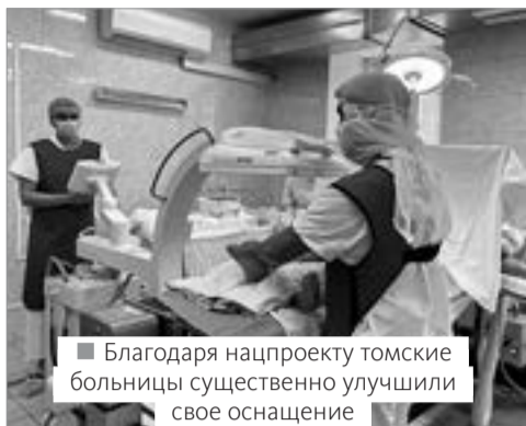
■ Благодаря нацпроекту томские больницы существенно улучшили свое оснащение