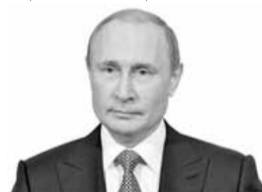
Владимир Путин, президент Российской Федерации

“ Волонтеры и НКО – наши самые надежные партнеры и единомышленники. И им нужно оказывать необходимое содействие. И не только сейчас, в нынешней экстраординарной ситуации. А всегда, при любых обстоятельствах. Потому что от волонтеров, от тех людей, которые трудятся в некоммерческих организациях, от их энергии и гражданской инициативы во многом зависит решение и сегодняшних, и даже долгосрочных задач, которые стоят перед нашей страной.