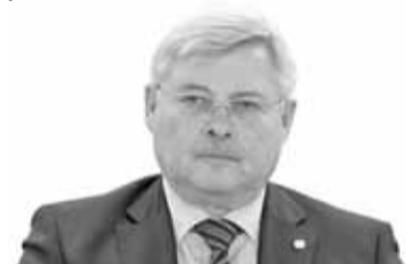
Сергей Жвачкин, губернатор Томской области

“ Как председателю наблюдательного совета томского политеха мне вдвойне радостно за молодых ученых ТПУ, удостоенных правительственной премии вместе с коллегой из Томского национального медицинского центра. Важно, что наши люди стали лауреатами правительственной премии в составе групп разных научных организаций. Эта интеграция является коньком нашего томского проекта «Большой университет», и она показывает свою успешность.