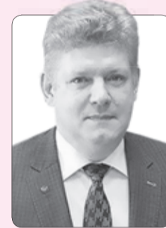
Анатолий Серышев, полномочный представитель Президента Российской Федерации в Сибирском федеральном округе

Дорогие друзья! От всего сердца желаю вам новых достижений в службе, семейного счастья, здоровья и всего самого доброго!