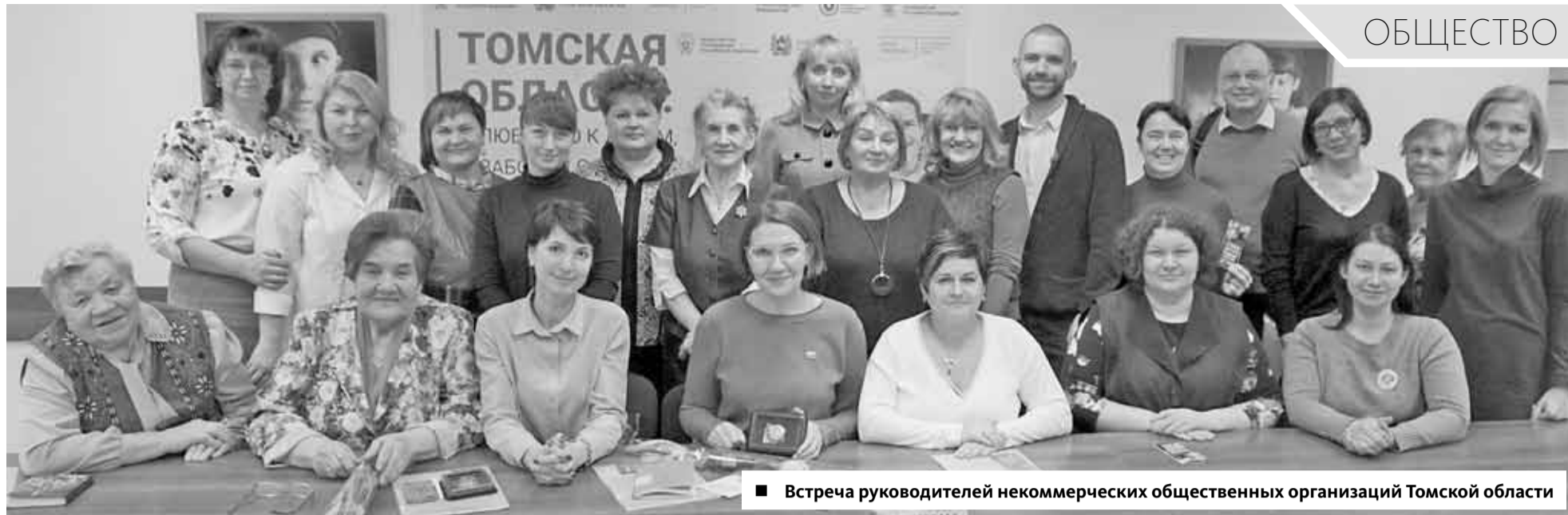
■ Встреча руководителей некоммерческих общественных организаций Томской области