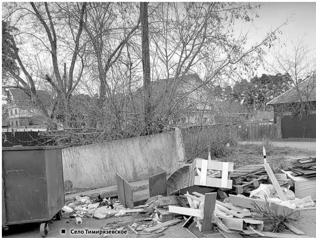
■ Село Тимирязевское