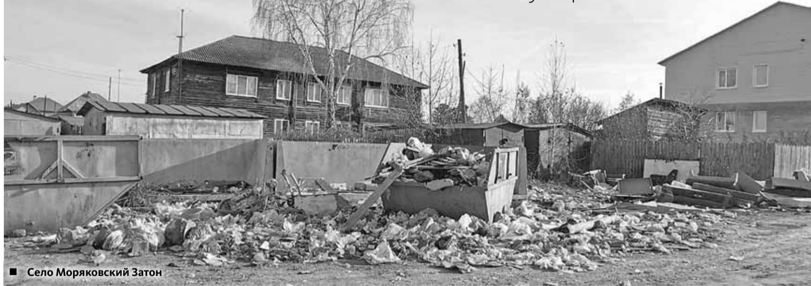
■ Село Морьяковский Затон

Почему томское предместье погрязло в мусорных свалках