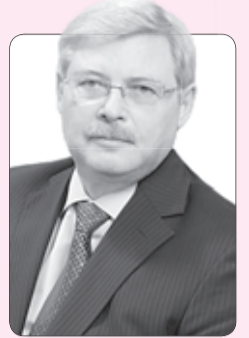
Сергей Жвачкин, губернатор Томской области

Поздравляем вас с Днем народного единства!