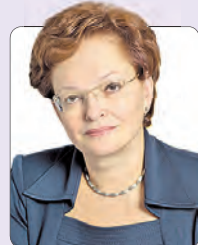
Оксана Козловская, председатель Законодательной думы Томской области