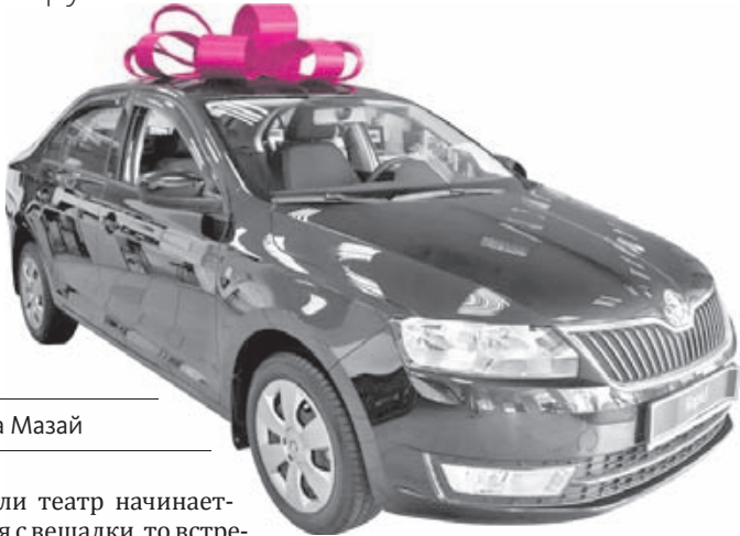
■ Вера Мазай

Лучший таксист региона получит новый руль