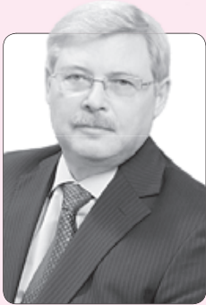
Сергей Жвачкин, губернатор Томской области

посетили за три дня выставку-ярмарку «Золотая осень. Урожай – 2017».