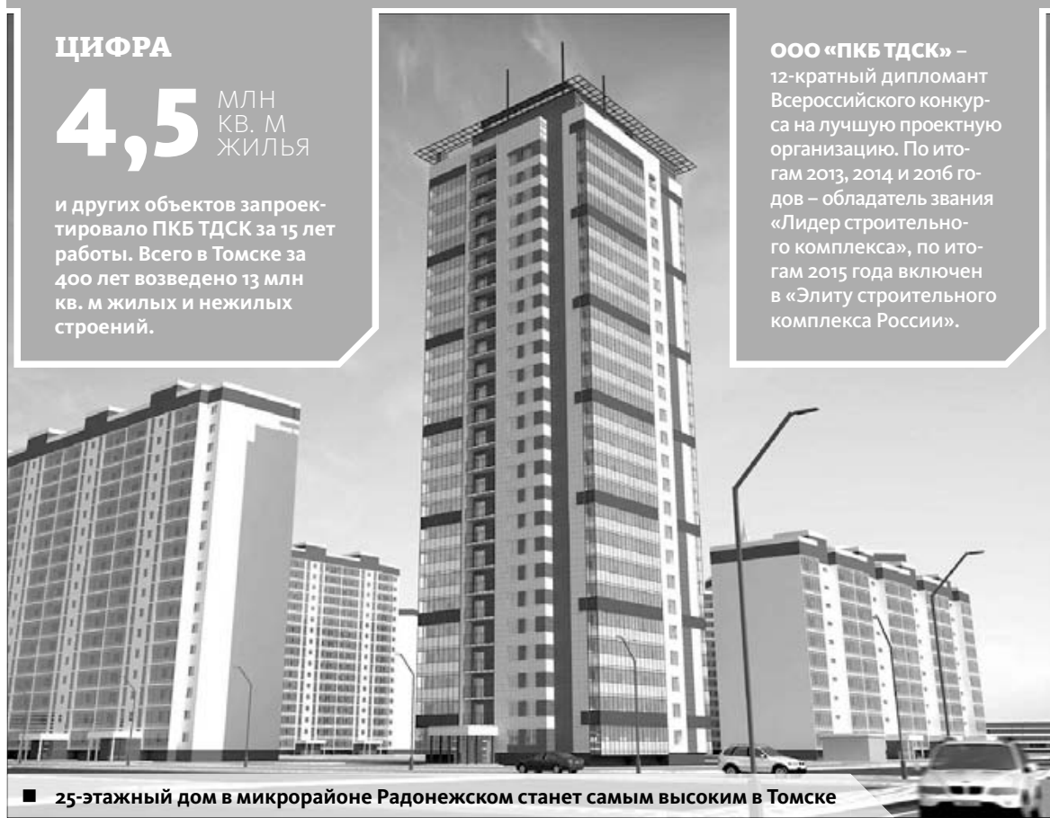
■ 25-этажный дом в микрорайоне Радонежском станет самым высоким в Томске

ООО «ПКБ ТДСК» – 12-кратный дипломант Всероссийского конкурса на лучшую проектную организацию. По итогам 2013, 2014 и 2016 годов – обладатель звания «Лидер строительного комплекса», по итогам 2015 года включен в «Элиту строительного комплекса России».