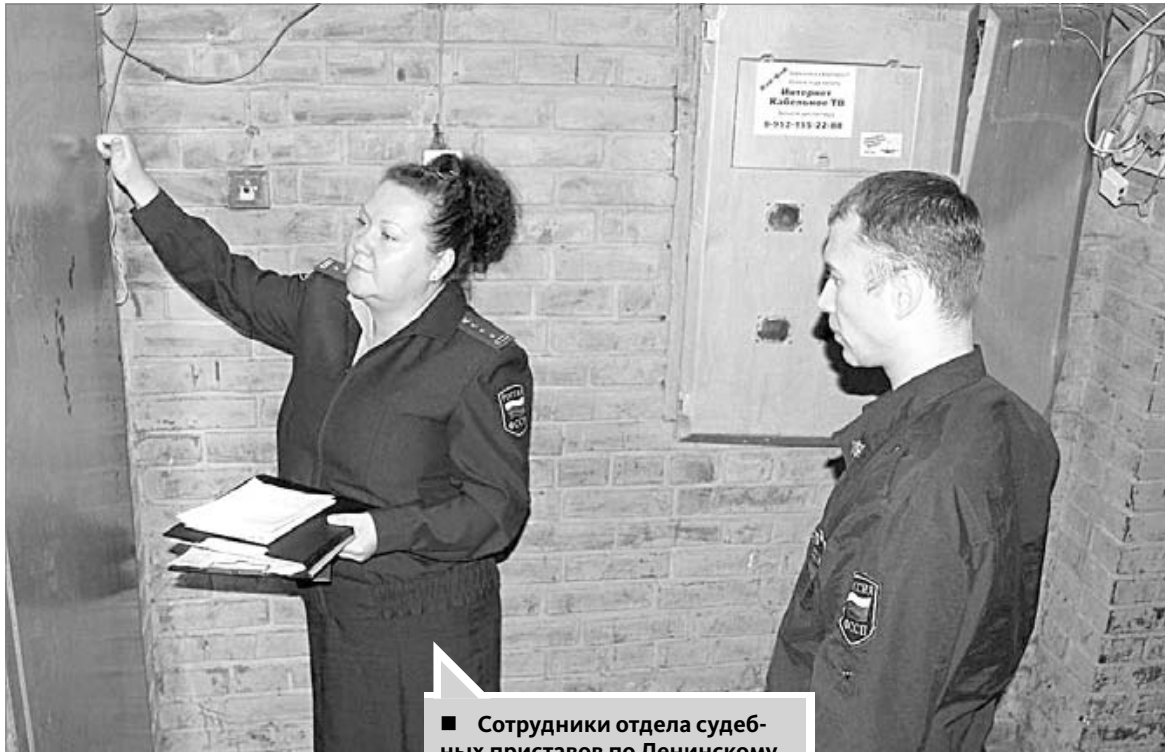
■ Сотрудники отдела судебных приставов по Ленинскому району Томска на исполнительных действиях

нина известие, что ему нельзя садиться за руль?