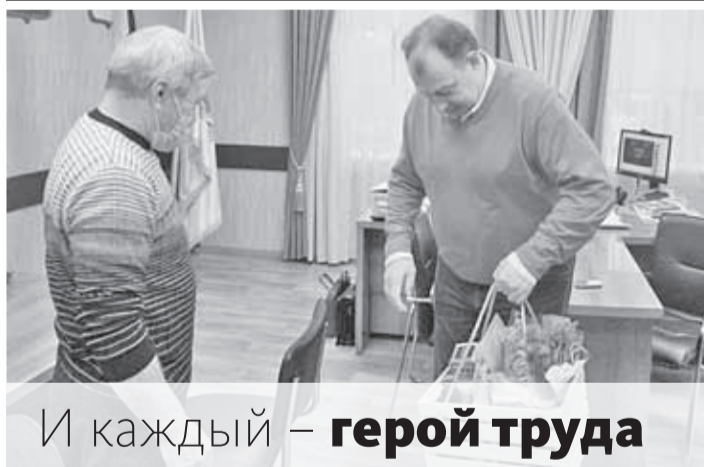
И каждый – герой труда

27 ЗАСЛУЖЕННЫХ тружеников села региона: комбайнеры и механизаторы, агрономы, зоотехники, бухгалтеры и инженеры – получили к профессиональному празднику открытки и подарки с доставкой на дом.