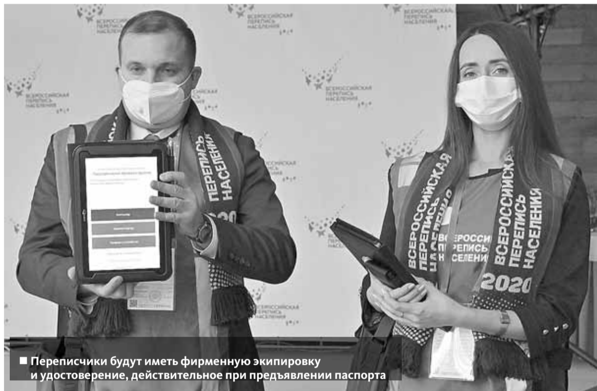
■ Переписчики будут иметь фирменную экипировку и удостоверение, действительное при предъявлении паспорта

15 октября в России стартовала первая цифровая перепись населения