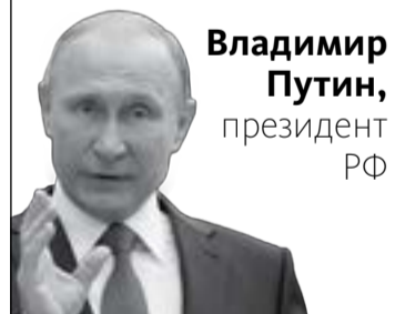
Владимир Путин, президент РФ

Мы должны строить свое будущее на прочном фундаменте. И такой фундамент – это патриотизм.