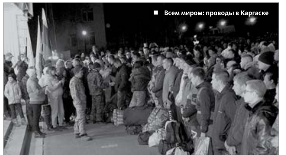
■ Всем миром: проводы в Каргаске

Предприниматели и администрация района в срочном порядке закупили продуктовые наборы, рюкзаки, спальные мешки, одежду и передали все это своим землякам, вставшим в ряды защитников Отечества... Все объединились в непримиримой борьбе с современной коричневой чумой, даже дети. Они написали свои письма солдатам. Трогательные. Со словами поддержки и веры в то, что Россия обязательно победит.