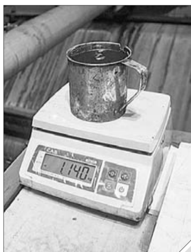
■ Среди огромного количества современных технологий приятно заметить и дедовский метод – чашка на весах, наполненная породой, помогает скорректировать показания приборов