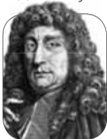
Шарль Пино Дюкло (1704—1772), французский историк, писатель

“ Когда умные и честные люди действуют заодно, глупцы и мошенники отступают.