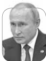
Владимир Путин, президент РФ

«Телефонные мошенники – это просто подонки! ...Число совершенных ими преступлений серьезно растет, и одна из причин – очень много личных данных в свободном доступе. На это надо обратить внимание силовикам. Фишинговые сайты – это от слова «рыба», наверное, и они ищут своих жертв в Сети. Раньше для того чтобы найти и закрыть такие сайты, у ЦБ уходило несколько месяцев. Сейчас это занимает не больше трех дней...»