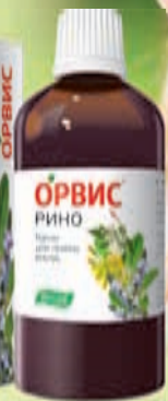
Капли для приема внутрь