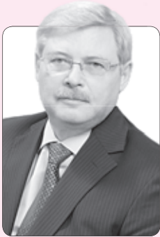
Сергей Жвачкин, губернатор Томской области

И еще об одном хочется сказать. Сейчас вовсю разворачиваются сезонные ярмарки, когда фермеры и частники привозят свои продукты и продают их горожанам. Они есть во всех городских районах. Но подошла торговля к завершению – и кончен бал! А дальше опять торговля от случая к случаю. И как тут не вспомнить любимый горожанами рынок на ул. Дзержинского. Такого уютного и праздничного места на открытом воздухе в Томске больше нет. До сих пор берут сомнения, а надо ли было лишать томичей возможности делать покупки с удовольствием, в радость, в угоду облагоустроенному пространству, превращенному в стоянку для автомобилей?