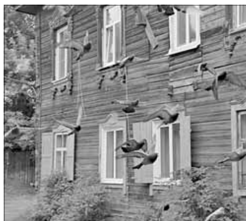
■ Здесь уже проведена масштабная работа по сносу и подрезке возрастных деревьев, демонтирована часть металлических гаражей, собран случайный мусор, фасады домов и ограждения приводят в порядок их собственники