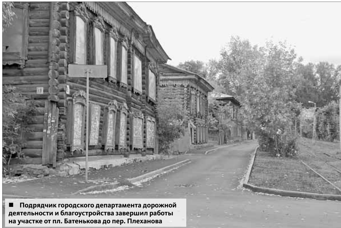
■ Подрядчик городского департамента дорожной деятельности и благоустройства завершил работы на участке от пл. Батенькова до пер. Плеханова

Конечно, не будем Бога гневить. Все-таки несколько сотен человек здесь живет, и асфальт