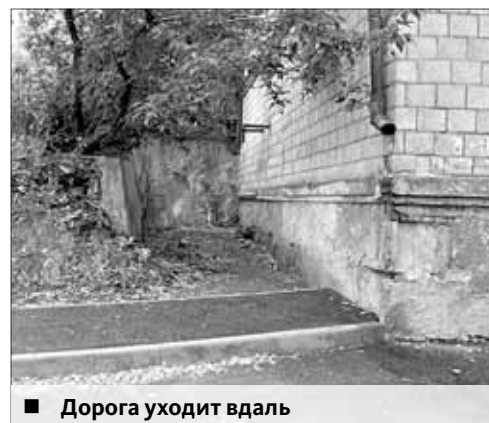
■ Дорога уходит в даль