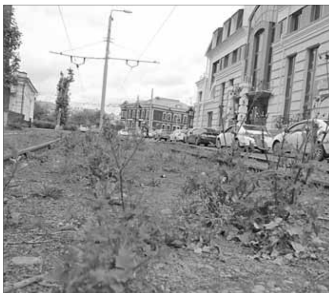
■ Цветы запоздалые