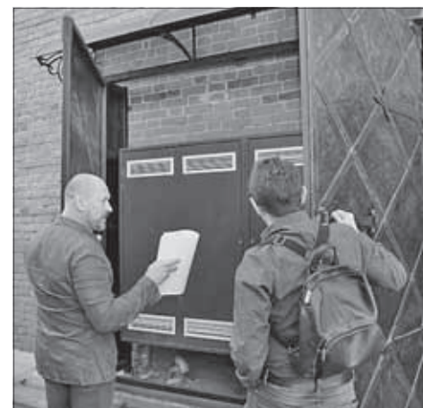
■ Управление фонтанами

В декабре 2018 года мэрия объявила аукцион по продаже нежилого помещения площадью 133 кв. метра. Начальная цена составляла около 10 млн рублей.