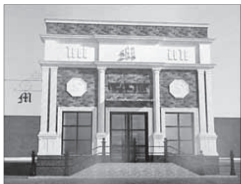
■ Реконструкция фасада здания по Набережной Ушайки, 18а