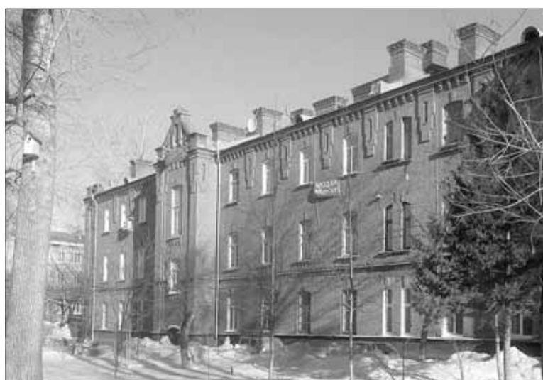
■ Заводуправление ТИЗа с 1943 года

Так в годы военного лихолетья зарождалась история Томского завода режущих инструментов.