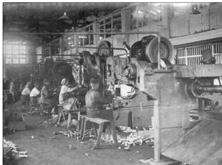
■ Один из цехов ТЭМЗа, 1940-е годы

но. Возникла другая проблема – квалифицированных рабочих не хватало, а обучать юных томских пацанов индивидуально не было времени.