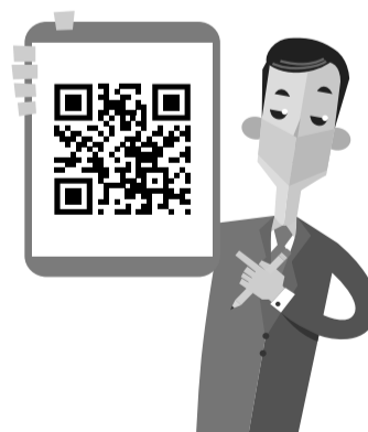
График работы избирательных комиссий по приему заявлений о включении избирателя в список избирателей по месту нахождения