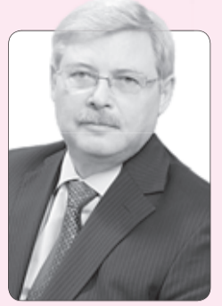
Сергей Жвачкин, губернатор Томской области

Поздравляем вас с Днем Государственного флага России!