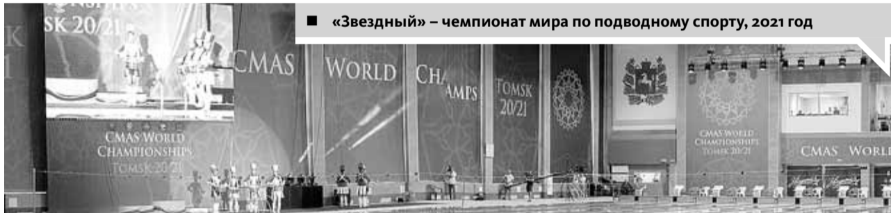
■ «Звездный» – чемпионат мира по подводному спорту, 2021 год

НА ОТКРЫТИИ каждого социального объекта домостроители всегда дарят его будущим хозяевам символический ключ – как эталон качества, надежности и нового пути развития.