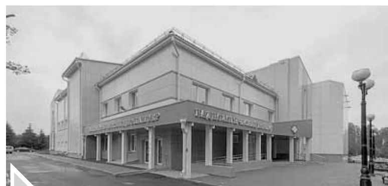
■ Радиологический корпус онкодиспансера открыт в 2015 году

– Бассейн тоже начинали строить некоторые московские фирмы, потом бросили, нам пришлось достраивать. Пришлось по ходу менять целый ряд конструктивных решений, внести изменения в размеры чаши основного бассейна. Не хватало нескольких сантиметров, так как наши предшественники исказили размеры, и нам пришлось приводить чашу в порядок. Теперь там все точно так, как требуется по олимпий-