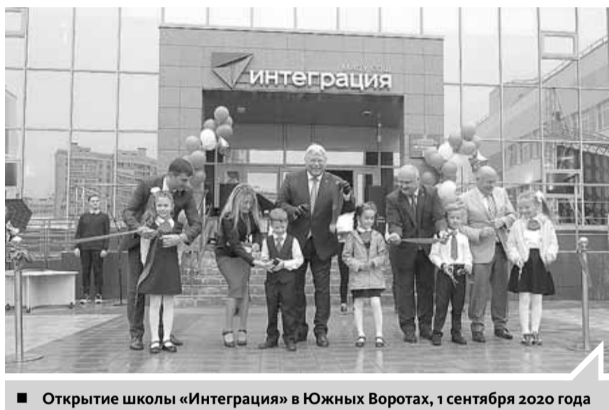
■ Открытие школы «Интеграция» в Южных Воротах, 1 сентября 2020 года

«Комплексный подход к строительству жилых районов является частью стратегии компании с самого начала нулевых годов. Точечная застройка – это не наш уровень и уж точно не наш масштаб.