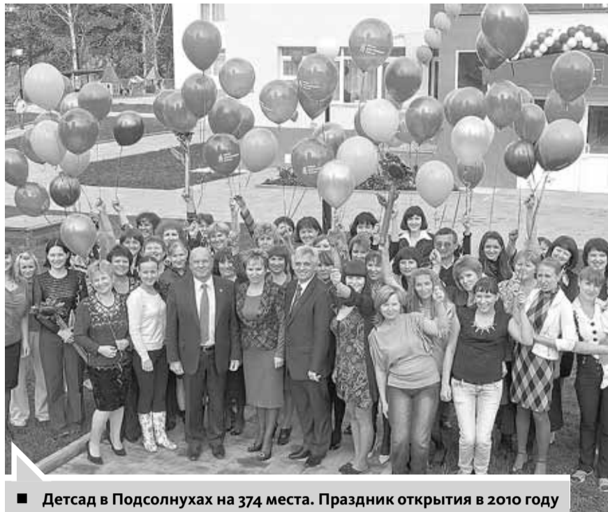
■ Детсад в Подсолнухах на 374 места. Праздник открытия в 2010 году