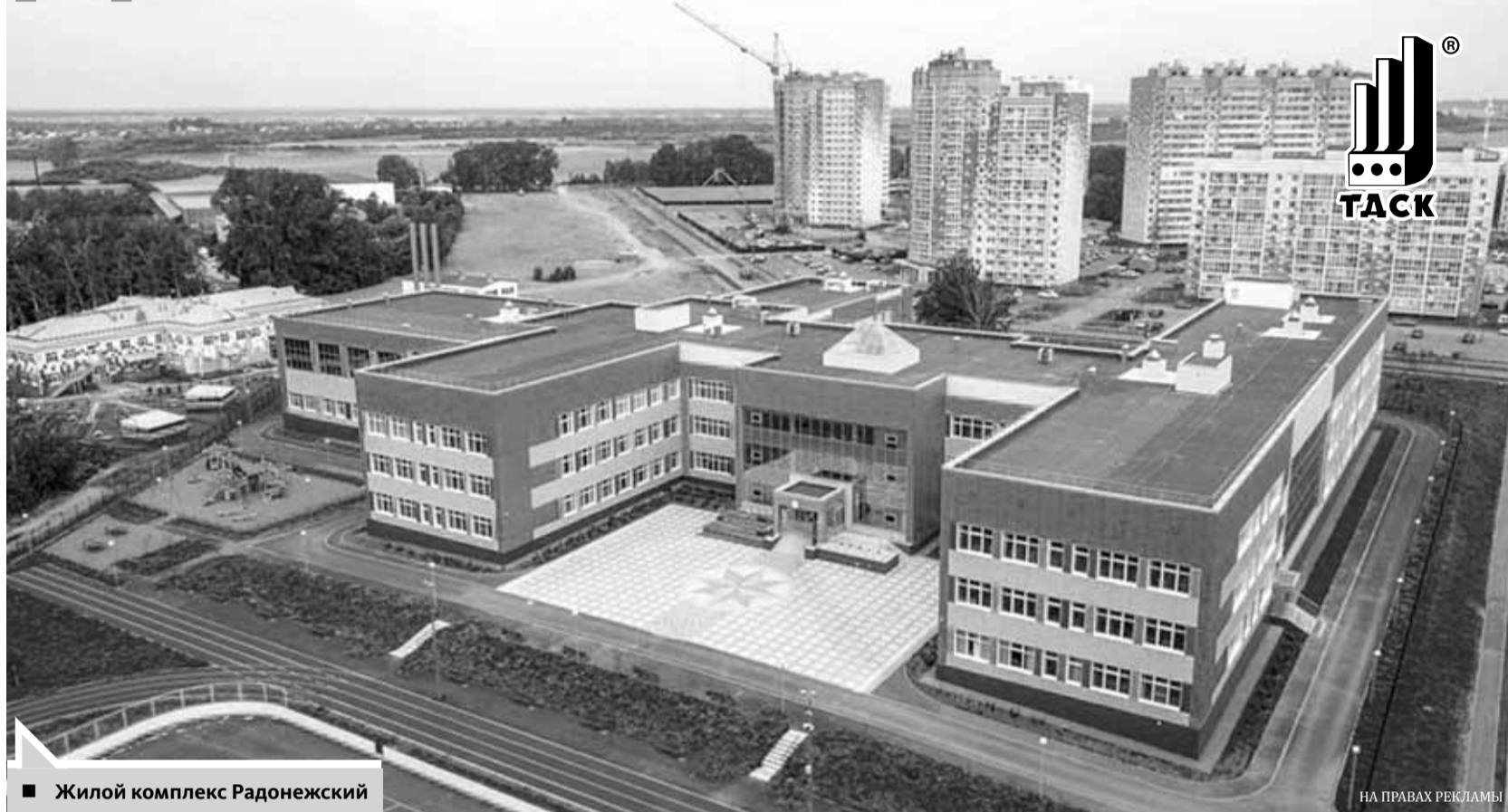
■ Жилой комплекс Радонежский