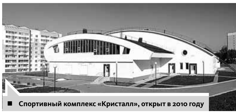
■ Спортивный комплекс «Кристалл», открыт в 2010 году

– История этой стройки очень интересная. Она начиналась еще в советские времена, затем более 20 лет стояла в запуске и пришла в такое состояние, что перед тем как начинать новое строительство, пришлось снести все, что там было. Но мы взялись за нее, в 2014 году ввели этот корпус, а в начале 2015 года отдали в управление врачам. Сама по