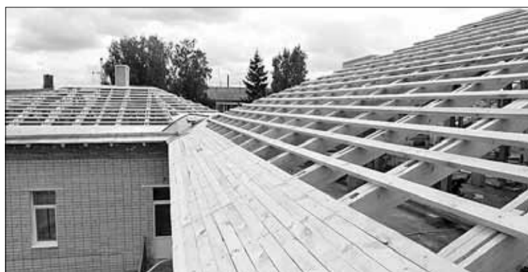
■ Новая крыша детского сада «Журавушка»