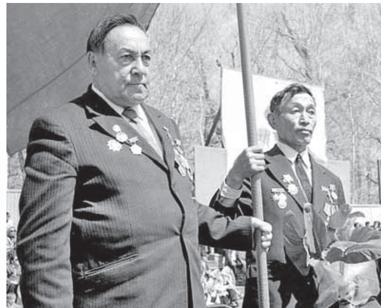
■ Два Героя Советского Союза – Леонид Ефимов и Хомушку Чургуй-оол