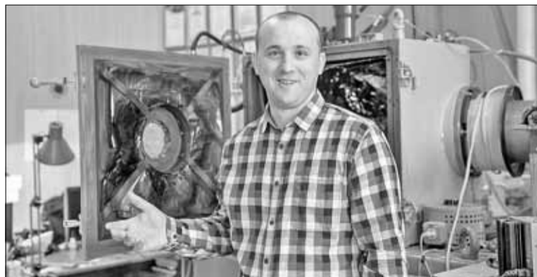
■ Применение такого механического насоса позволит многим пациентам дожидаться пересадки донорского сердца, а в некоторых случаях и вовсе избежать его, позволив родному сердцу чуть-чуть передохнуть

недостаточная износостойкость, тромбообразование на внутренних поверхностях изделий и разрушение эритроцитов в процессе перекачки крови. Так родилась идея – попробовать нанести кремний-углеродные пленки на титановые изделия насосов, тем самым улучшив свойства отечественных медицинских имплантатов.