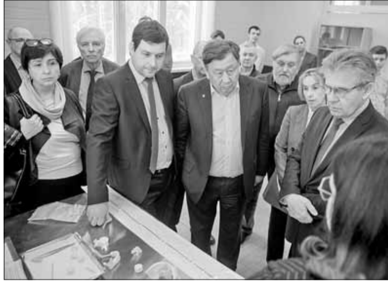
■ Визит президента РАН Александра Сергеева в ИФПМ СО РАН

появился не в центральной части России, а в Сибирском федеральном округе. В случае если наша заявка получит одобрение, это даст мощнейший импульс развитию всего научно-образовательного комплекса Томска.