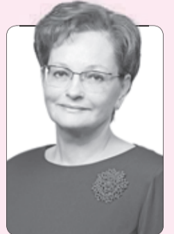
Оксана Козловская , председатель Законодательной думы Томской области