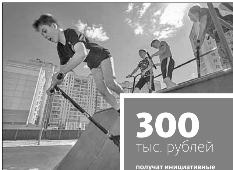
■ Один из победителей «Вместе-2018» – роллердром в Подсолнухах

Жители трех районов Томска получают гранты ТДСК на реализацию своих идей