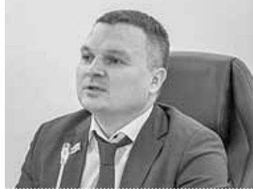
Сергей Панов, спикер Думы города Томска:

– Вопрос о маневренном жилье в повестке комитета городского хозяйства появился неспроста. В Думу поступило несколько обращений, в которых люди говорят о том, что предложенные им для временного переселения помещения не отвечают элементарным условиям для проживания. И приходится искать какие-то варианты самостоятельно. Нас очень настораживает такая ситуация. Городские депутаты неоднократно выезжали на осмотры маневренного фонда. Мы понимаем, что объективно жилье, в котором люди поселяются временно, стареет быстрее, а потому износ постоянно растет. В Томске большая часть маневренных помещений непригодна к проживанию полностью или частично, и люди, которым в силу разных причин необходима помощь муниципалитета, ее получить не могут и вынуждены искать другие варианты. Это неправильно. Наши граждане должны знать – случись беда, власть всегда протянет им руку помощи. Иного быть не должно.