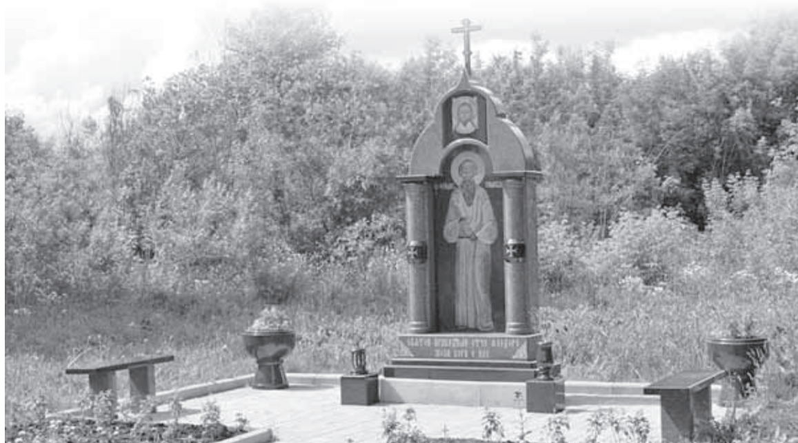
■ Памятник Федору Кузьмичу на месте его кельи на заимке купца Семена Хромова (современный поселок Хромовка в Томской области). Старец Федор скончался 20 января 1864 года и был похоронен на территории Алексиевского монастыря в Томске

Как это часто бывает на Руси, почитание старца усилилось после его смерти, последовавшей 20 января 1864 года (по старому стилю), когда ему было около девяноста. Как писал Адрианов, кружок почитателей Федора Кузьмича собирал и издавал о нем материалы, «нанизывая и нужным образом освещая разные мелочи из жизни старца». Обе кельи