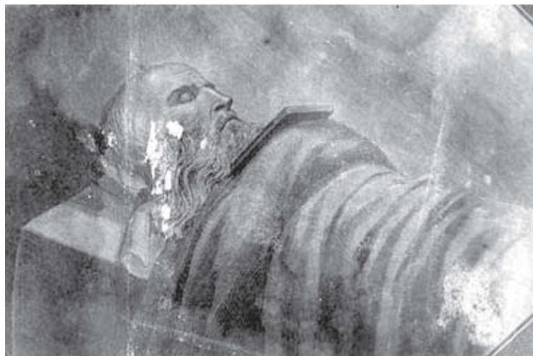
■ Старец Феодор Кузьмич. Посмертный рисунок

Легенда, в которую верил Лев Толстой и члены царской семьи