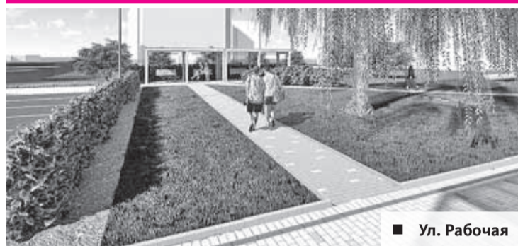
■ Ул. Рабочая

Подведены итоги голосования за объекты благоустройства общественных пространств в Томске на 2023 год.