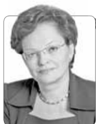
Оксана Козловская, председатель Законодательной думы Томской области