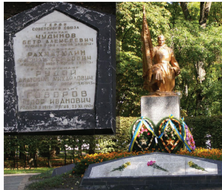
■ Братская могила, в которой похоронены Герои Советского Союза Ф.И. Говоров, Ш.С. Рахматуллин, А.М. Рудой, П.А. Чудинов. Город Чернигов, парк на Валу. Автор фотографии – Олег Кожухарь, сентябрь 2008 года