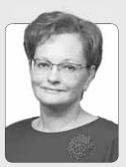
Оксана Козловская, председатель Законодательной думы Томской области