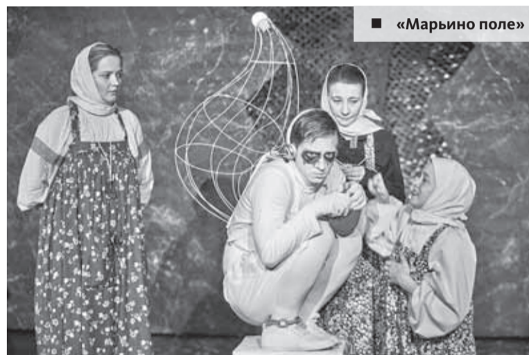
■ «Марьино поле»

Томичи познакомились с лучшими постановками новосибирцев