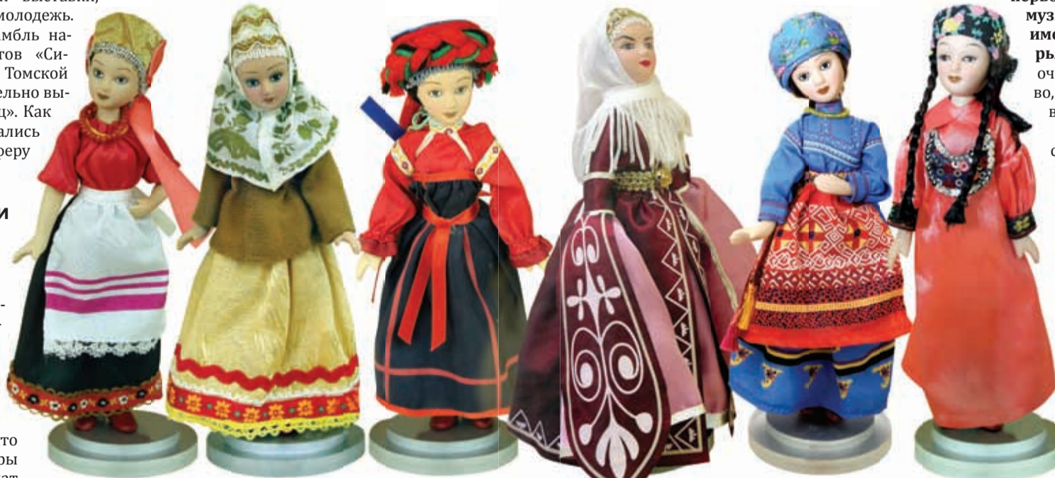
ЛЕТНИЙ КОСТЮМ НОВГОРОДСКОЙ ГУБЕРНИИ