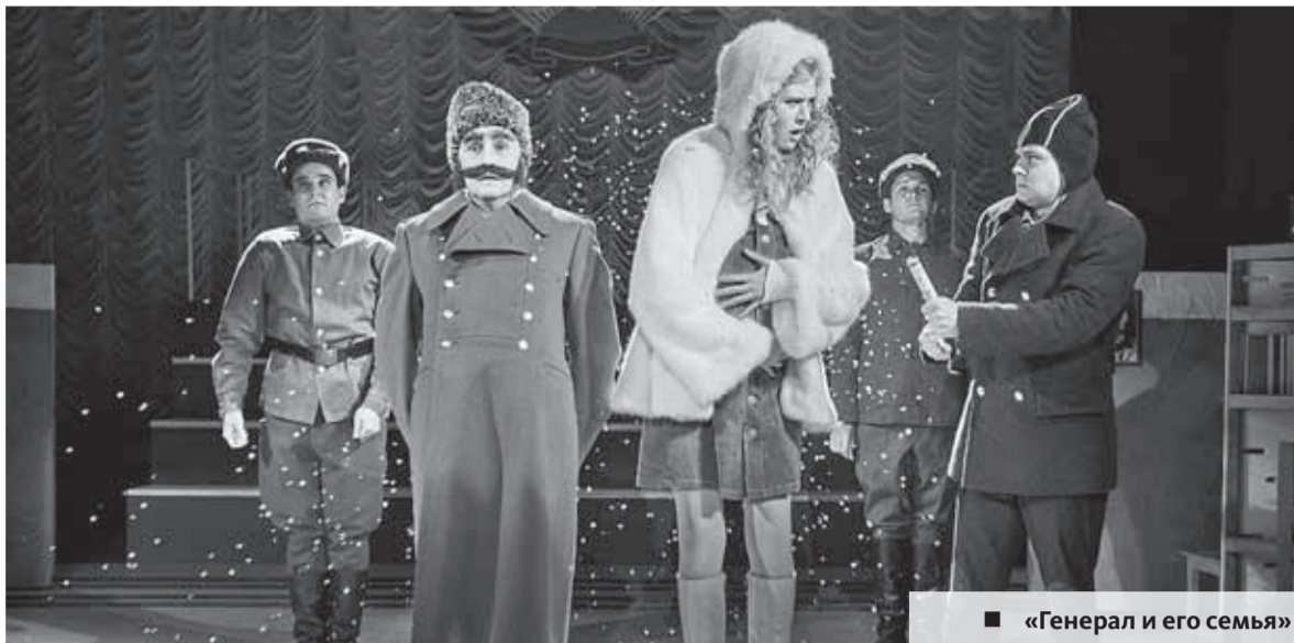
■ «Генерал и его семья»