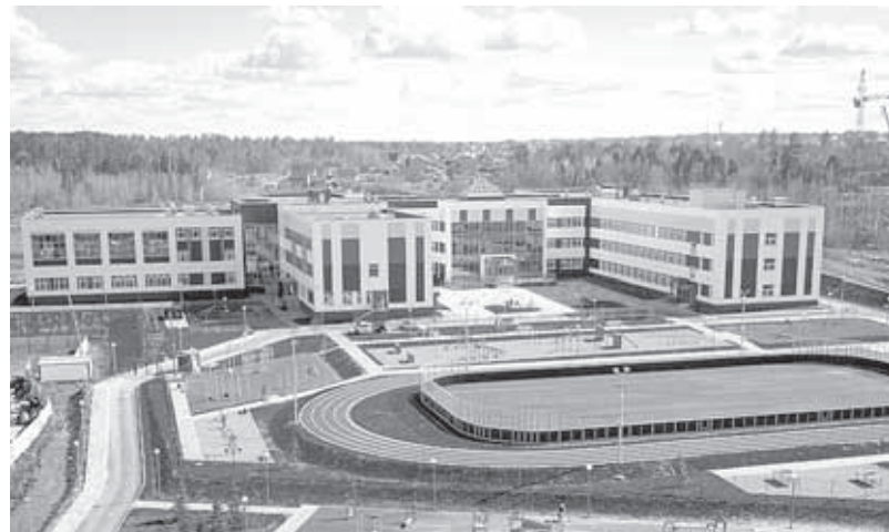
Школа «Интеграция» в Южных Воротах

В рамках центров для школьников будут реализовываться до-