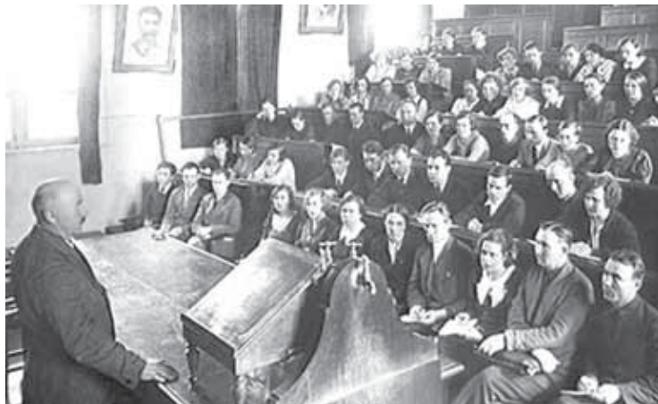
Досрочный выпуск ФМФ ТГУ (4-й курс). Июль 1941.

За 1941–1944 годы преподавателями и научными сотрудниками вузов Томска были защищены 34 докторские и 103 кандидатские диссертации