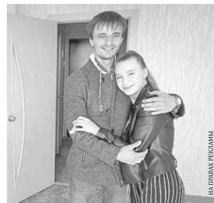
НА ПРАВЫХ РЕКЛАМЫ

В мае десятки семей томичей также отметили новоселье в доме в пер. Речном, 3, в жилом комплексе Радонежском.