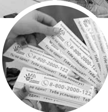
■ Прием граждан

Еще очень важное направление работы – просветительская деятельность. При уполномоченном создан Детский общественный совет, куда входят ученики из разных школ Томска. Ребята приняли участие в социальном