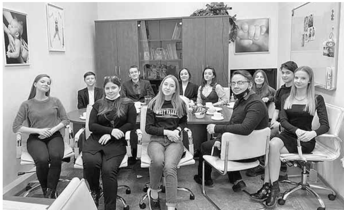
■ Детский общественный совет при уполномоченном по правам ребенка в Томской области

– Таких случаев и сейчас достаточно. По разным причинам невозможно взыскать алименты на содержание детей. И это серьезное нарушение прав ребенка. Учитывая значимость проблемы, мы предложили руководителю Управления Федеральной служ-