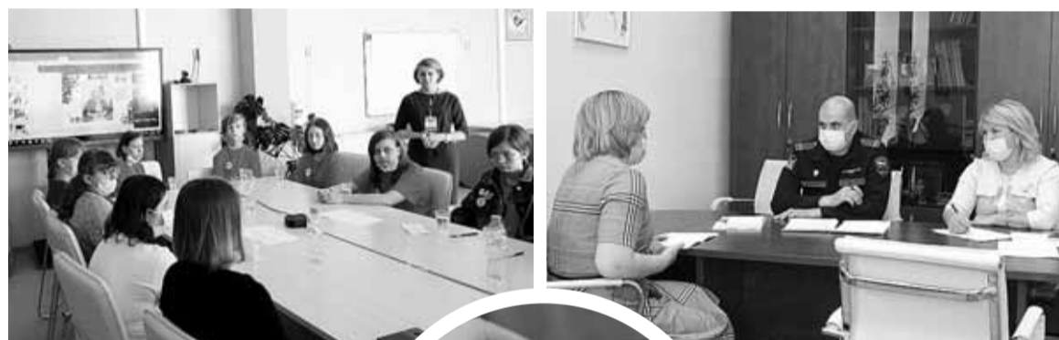
■ Слет юных медиаторов

бы судебных приставов по Томской области 31 мая провести совместный прием. Обращений и звонков было много. Мы приняли девять человек, все жалобы взяты на контроль. Сегодня недостаточно эффективных механизмов принудительного взыскания задолженности по алиментам.