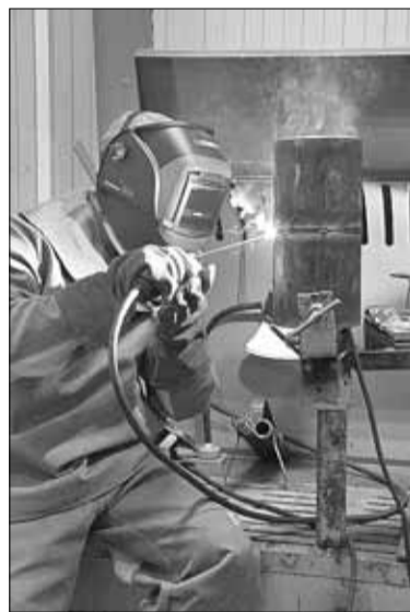
■ Валентина Артемьева