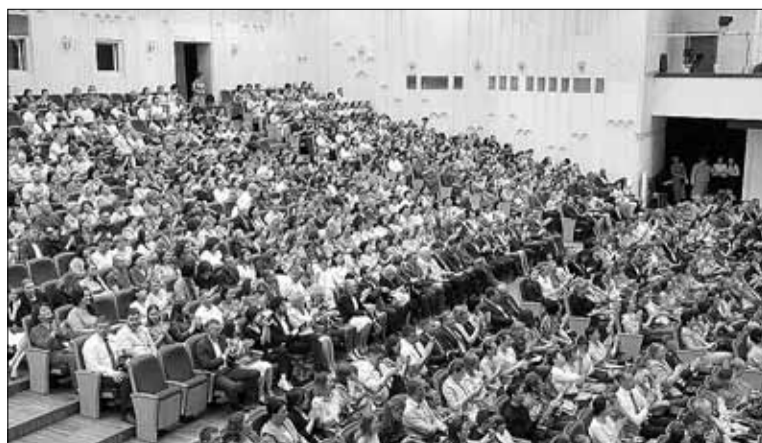
■ Аншлаг в Большом концертном зале Томской филармонии

А чем удивит Теодор Курентзис, один из самых неординарных и востребованных дирижеров современности, основатель и художественный руководитель оркестра musicAeterna? Кстати,