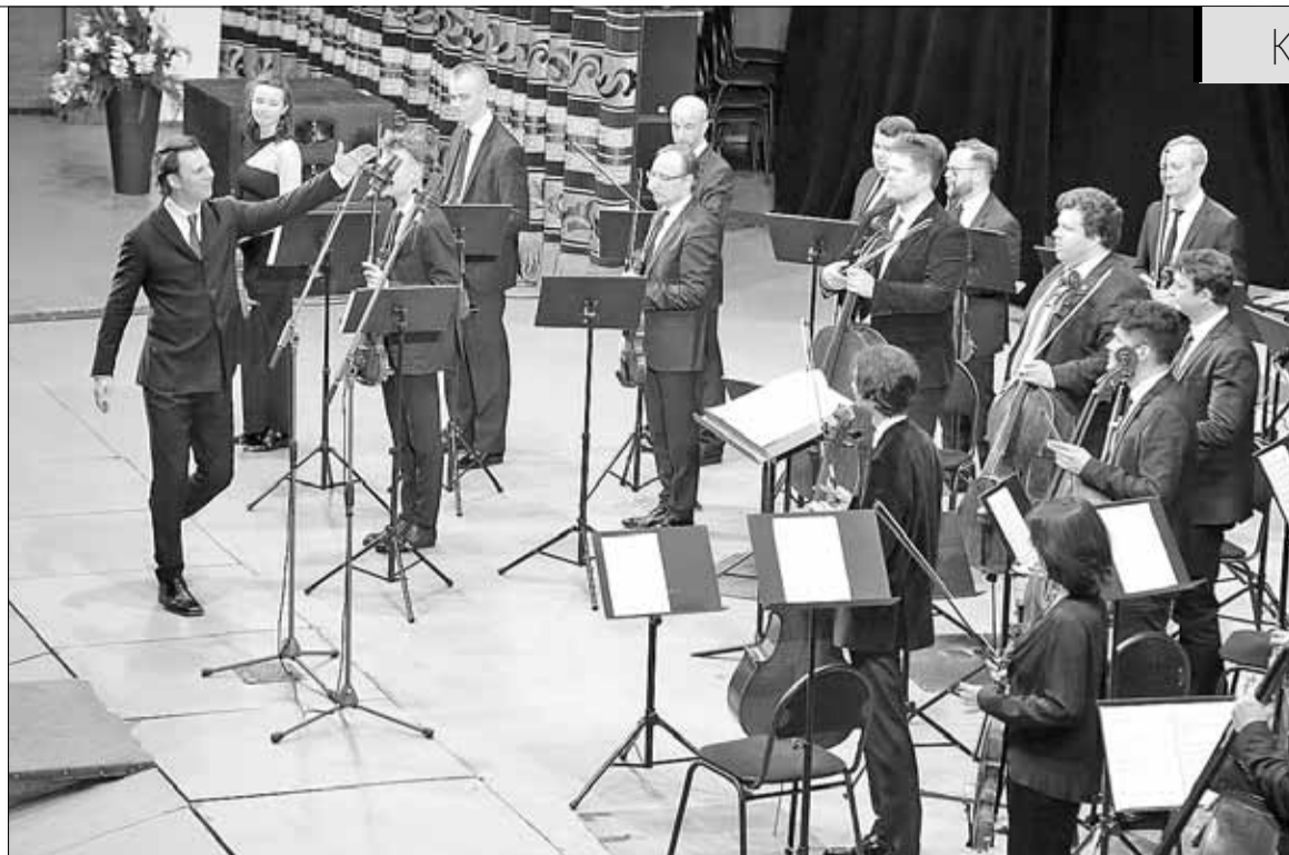
■ Теодор Курентзис представляет музыкантов

– Симфонические концерты я посещаю регулярно – это высо-