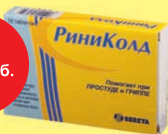
Риниколд табл. № 10