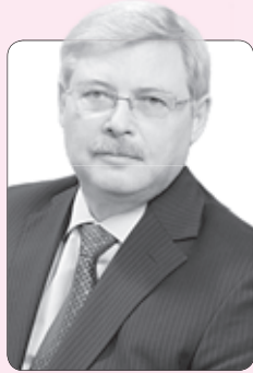
Сергей Жвачкин, губернатор Томской области

Желаем вам успехов в нелегкой, но очень нужной государству и обществу службе, здоровья, счастья и всего самого доброго!