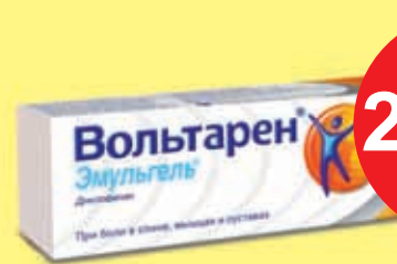
Вольтарен гель 1% 50 гр.