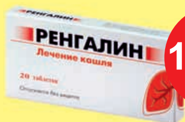
Ренгалин табл. № 20