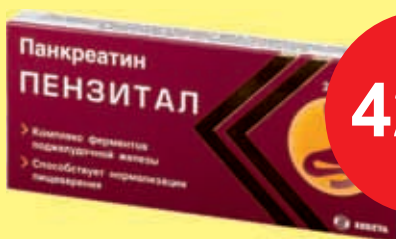
Пензитал табл. № 20