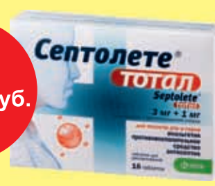
Септолете тотал табл. № 16