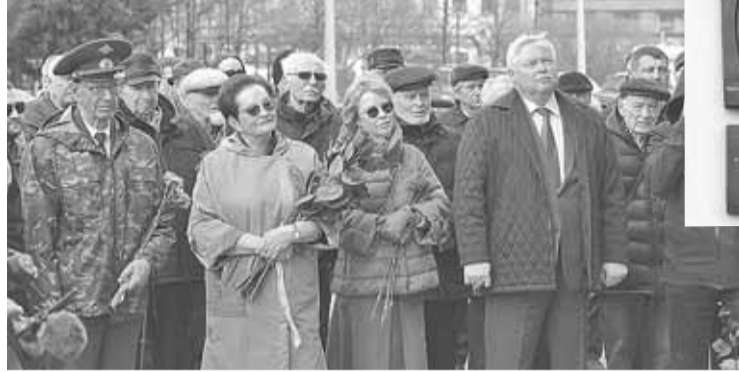
■ Фото: Игорь Крамаренко

В канун Дня Победы губернатор Томской области Сергей Жвачкин открыл мемориальную доску первому почетному гражданину Томской области, первому секретарю Томского обкома КПСС и члену Политбюро ЦК КПСС Егору Лигачеву.