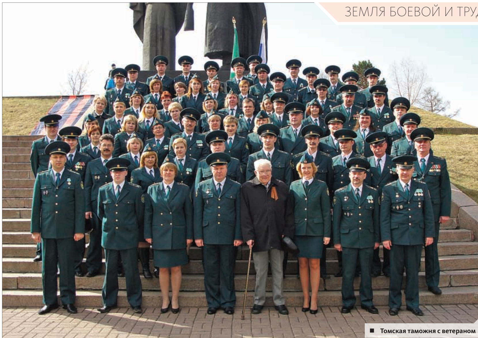
■ Томская таможня с ветераном