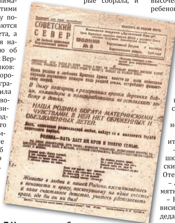
■ Молния газеты «Советский Север» от 4 сентября 1942 года, выпущенная вскоре после прибытия ленинградского детского дома в Вертикос