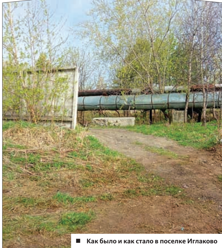
■ Как было и как стало в поселке Иглаково